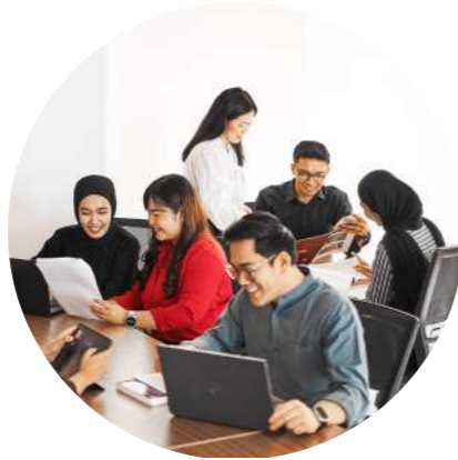
Monthly Coworking Space