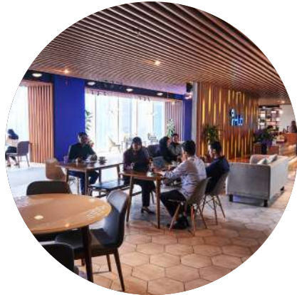
Daily Coworking Space

PT BSR Indonesia , melalui i-Hub , menghadirkan ruang kerja bersama yang dikenal sebagai The Most Strategic and Spacious Coworking Space in Jakarta . i-Hub dirancang khusus untuk para profesional yang membutuhkan lingkungan kerja yang luas, strategis, dan mudah dijangkau. Dengan keunggulan utama seperti Prominent Location, Pleasant Access , dan Premium Facilities .